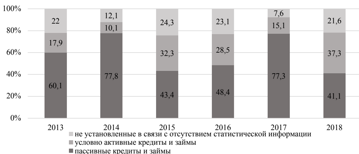
Рисунок 3. — Структура внешних кредитов (займов) Республики Беларусь

На рисунке 3 представлена структура привлеченных Республикой Беларусь внешних кредитов и займов в 2013–2018 гг. в соответствии с предложенным подходом к оценке эффективности государственного долгового портфеля.