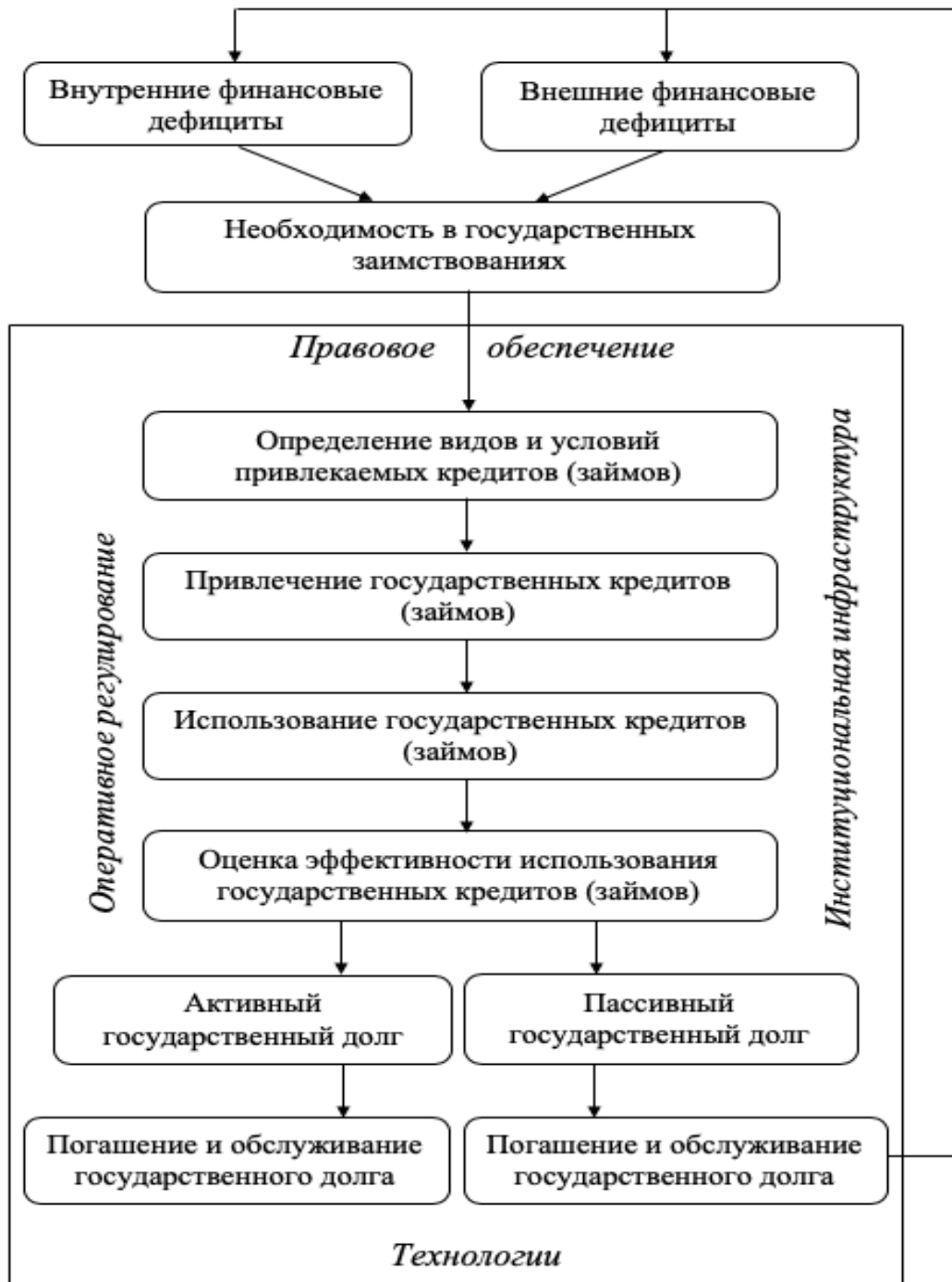
Рисунок 1. — Логическая схема долгового механизма в экономике

Во второй главе «Анализ и оценка государственного долга Республики Беларусь» рассмотрены и выделены четыре этапа развития государственного долга Республики Беларусь, определены внутренние и внешние финансовые дефициты как факторы государственного долга Республики Беларусь, разработан методический подход к оценке эффективности государственного долгового портфеля.