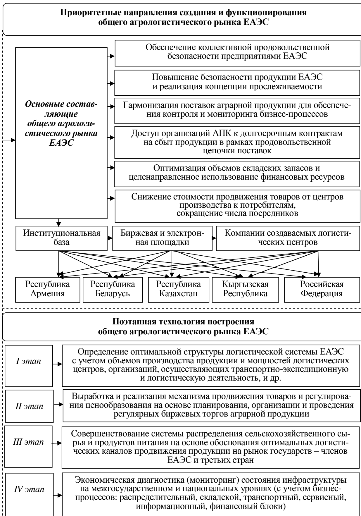
Рисунок 2. – Приоритетные направления создания и функционирования общего агрологистического рынка ЕАЭС

Примечание – Рисунок выполнен автором на основе собственных исследований.