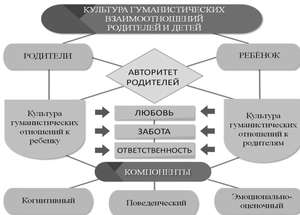
Рисунок 1. – Культура гуманистических взаимоотношений родителей и детей как система

Система детско-родительских отношений в контексте идей народной педагогики строится на безусловном авторитете родителей. Родительское отношение детерминируется любовью к детям и обусловлено их возрастом. Оно характеризуется бережным отношением к личности ребенка и вниманием к его